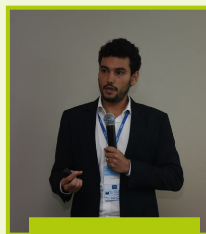
Case da Rede Mater Dei também integrou programação