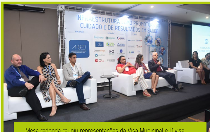
Mesa redonda reuniu representações da Visa Municipal e Divisa para debater as exigências regulatórias para a gestão da qualidade, tecnologias e segurança do paciente.