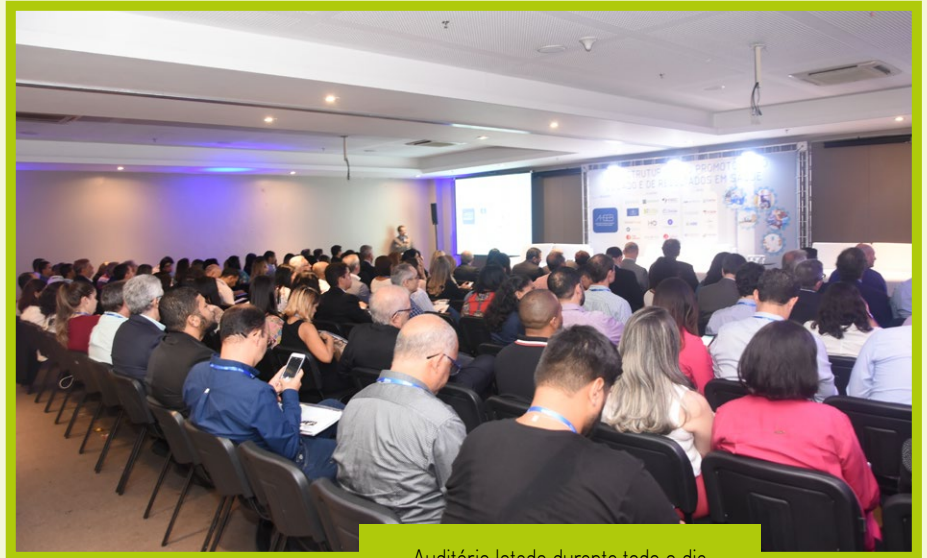
Auditório lotado durante todo o dia

A programação focou nos principais desafios e oportunidades relativas à infraestrutura da unidade de saúde, passando por práticas, conceitos, impactos nos processos de acreditação,