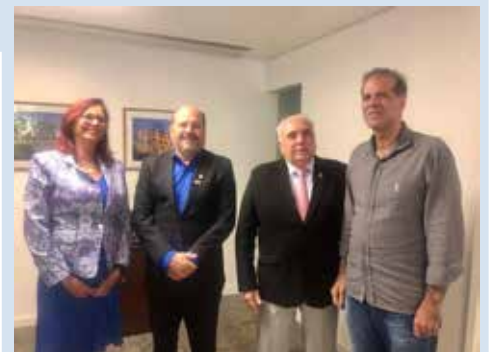
Visita à Secretaria Municipal de Cultura e Turismo

O maior conglomerado de análises laboratoriais do nordeste.