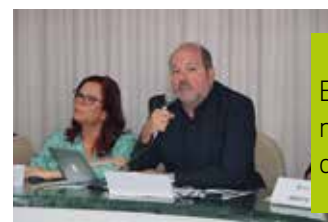
Exposição no Conselho de Turismo