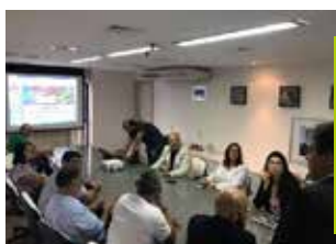
Reunião com trade turístico