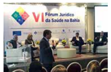
Discussões sobre novas tendências de gestão médico-hospitalar, compliance, reestruturação empresarial e parcerias público-privadas