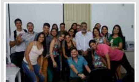
In Company : curso de faturamento básico em Jequié. Aulas também podem ir para outros estados.