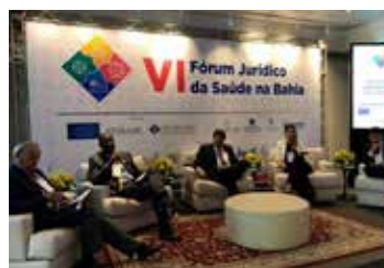
Aspectos diversos das inovações jurídico-tributárias que estão impactando no setor foram discutidos neste painel