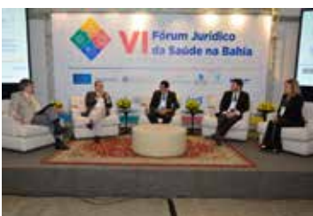
Painel que debateu a segurança jurídica e justiça contratual nas relações entre consumidor, operadora e prestadores de serviços