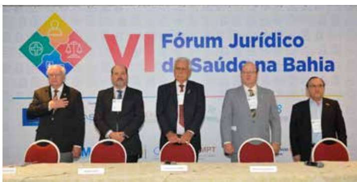
Mesa de abertura