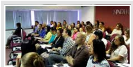
Cursos rápidos, com abordagem prática e com menor custo, caracterizam o Direto ao Ponto.

"O nosso desafio é fazer mais cursos voltados para as áreas técnicas e de equipe multiprofissional, e atrair também o público de gestão, não deixando de repetir o que sempre foi sucesso na Ucas", sinaliza sobre os desafios para os próximos períodos.