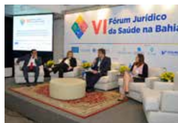
Os limites da responsabilidade das operadoras e prestadores de serviços nas relações de consumo